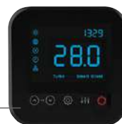
LED zaslon na dodir